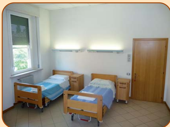
Le camere da letto