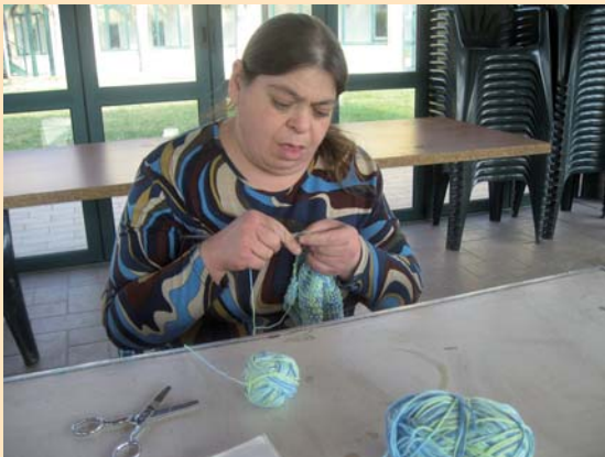
Cura di sé