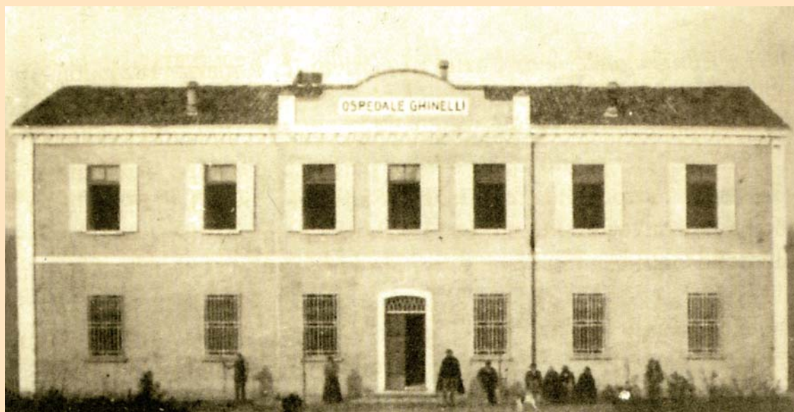
Entrata storica dell'Istituto Don Ghinelli