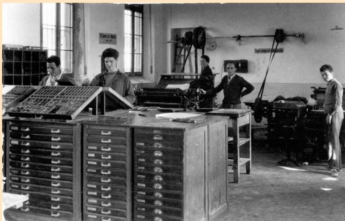
L'avviamento professionale: tipografia

Per l'attuazione di questo piano, egli si mise subito all'opera. Acquistò dal Comune un appezzamento di terreno in via Sant'Antonio, confinante con l'Asilo Infantile. Un anno dopo, un fabbricato di un solo piano poteva accogliere il laboratorio dei fiammiferi, che da Sant'Angelo passava a Gatteo. Successivamente ampliata, la casa, con il minuscolo opificio per fiammiferi, ospitò nel 1887 una calzoleria, nella quale, sotto la guida di