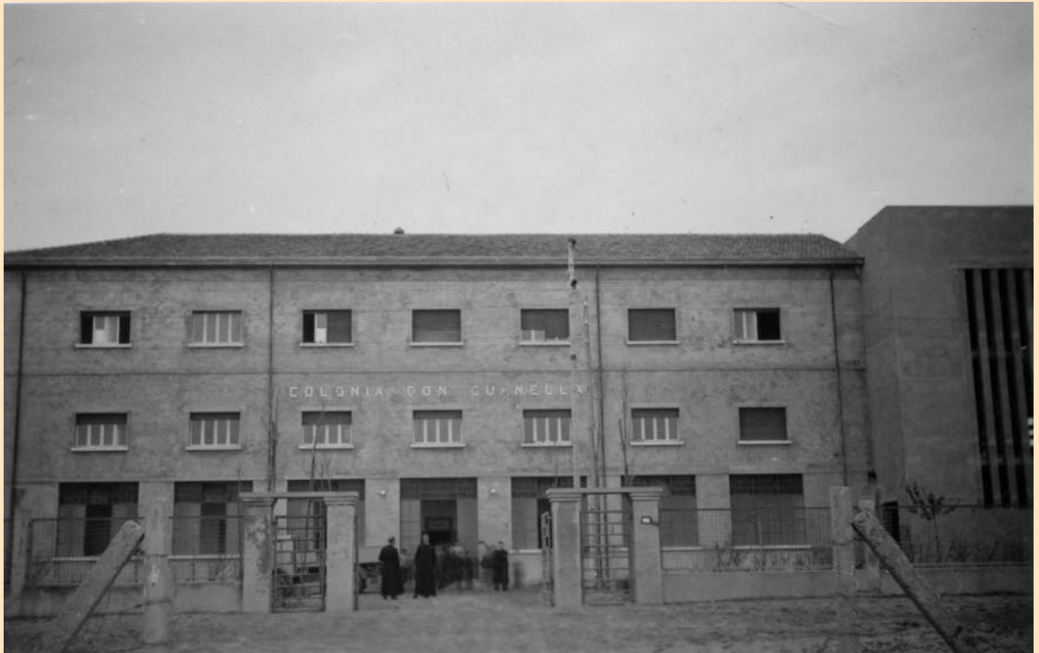
La colonia Don Guanella

di tinta rivoluzionaria. Essa non trovò nulla di compromettente; ma proprio quel 1898 doveva serbargli amare delusioni: furono chiuse la calzoleria e la falegnameria, dopo che qualche tempo prima aveva cessato la sua attività il laboratorio dei cappelli di paglia; nel 1900 chiuderà anche la fabbrica dei fiammiferi. Si parlò di fallimento; furono invece un complesso di cause che portarono al dissesto economico dell'impresa e alla relativa chiusura degli opifici.