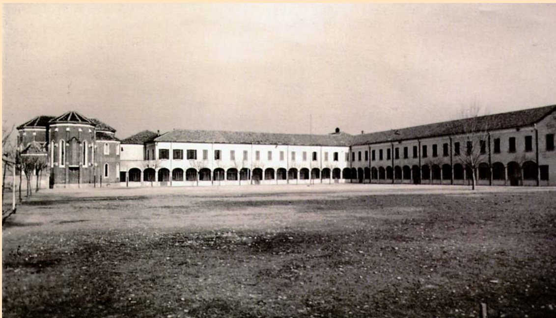
Il colonnato e l'ampio cortile

si riteneva fortunato chi veniva assunto in qualche fabbrica delle città o borgate vicine, con il disagio quotidiano di lunghe trasferte; non mancavano quelli che andavano a giornata presso i contadini: la paga era irrisoria, ma almeno si potevano sfamare.