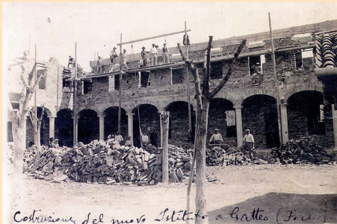
Gli inizi dell'Istituto