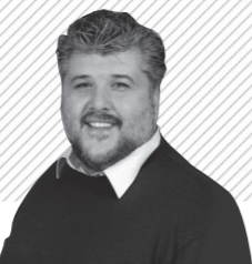
Gianluca Vincenzi Sindaco di Gatteo